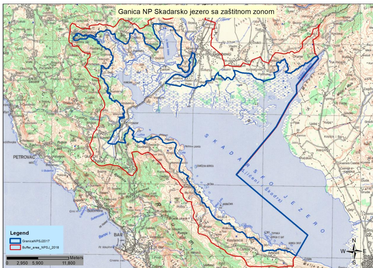
Mapa 2: Grafički prikaz nacionalnog parka sa zaštitnom zonom

Prostorni plan posebne namjene za NP Skadarsko jezero je donijet 2001. godine, odnosno prije Zakona o zaštiti prirode (SL.list. CG br.54/16), pa nema definisane zone zaštite u skladu sa članom 31. ovog zakona. Važeći Prostorni plan posebne namjene za NP Skadarsko jezero, definiše „zone kategorija vrijednosti“ Parka, a ne „zone i režime zaštite“, kao što je definisano Zakonom. Pored toga, definisane su dvije zone zaštite, suprotno članu 31. Zakona o zaštiti prirode koji definiše tri zone zaštite. Takođe, ovom Prostornim planom su definisani specijalni i opšti rezervati, a što je suprotno članu 20. Zakonu o zaštiti prirode, gdje se propisuju kategorije strogi rezervat i posebni rezervat.